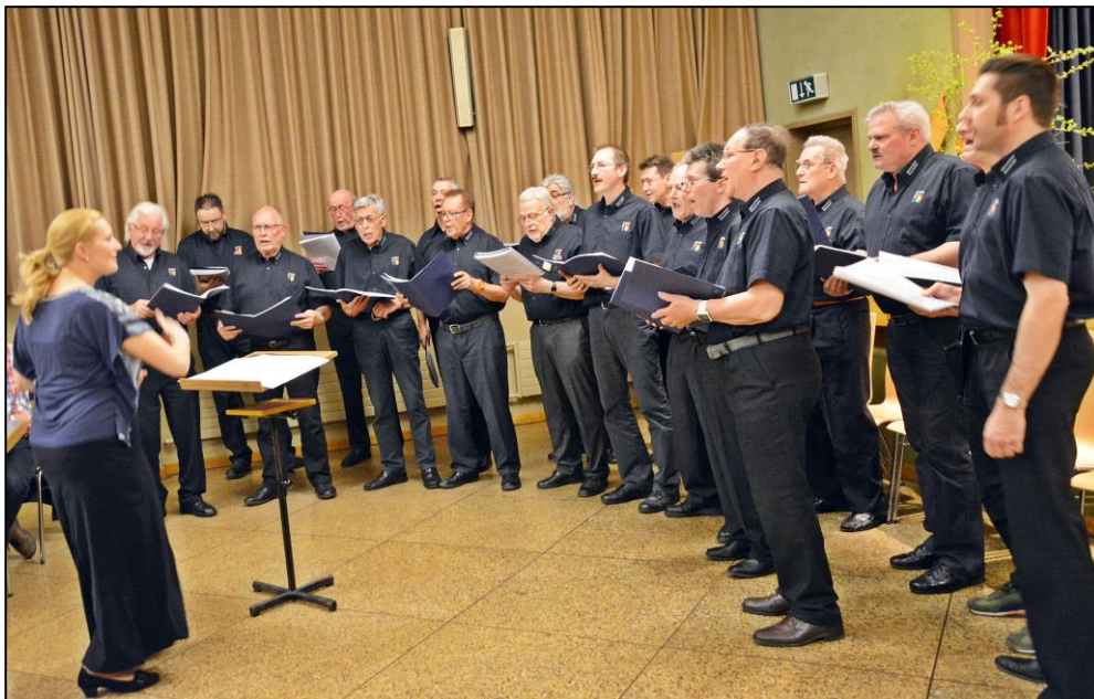
Der Männerchor Büsserach beim Eröffnungslied